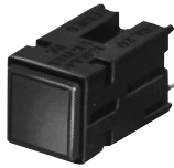
PWB-Befestigung (Einteiliger Stößel)